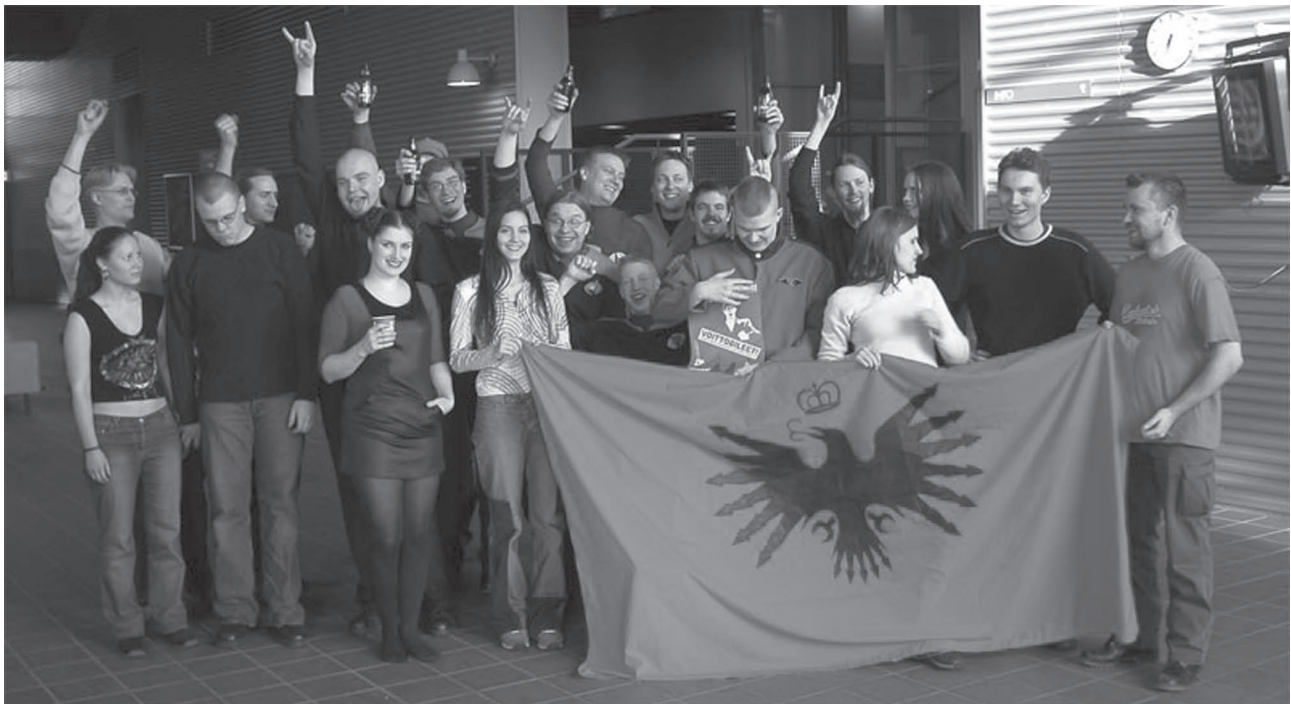
Star Wreck ei olisi syntynyt ilman fanejaan. Iloisia kuvaustiimin jäseniä Tampereen teknillisen korkeakoulun Festiäillä, joka sai toimia Baabel 13 -avaruusaseman sisätiloina.

kuitenkin käsikirjoituksesta melko aikaisessa vaiheessa pois. "Onneksi", sanoo Joutsen.